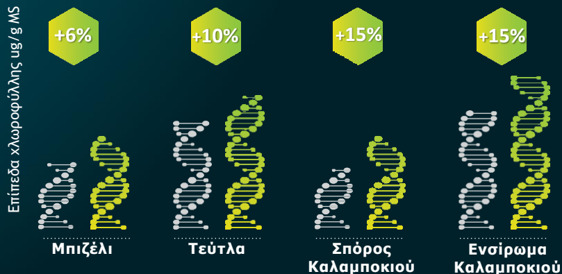
Επίδραση του Seactiv στα επίπεδα χλωροφύλλης